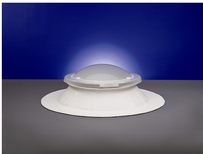
Światlik okrągły wersja nieotwierana